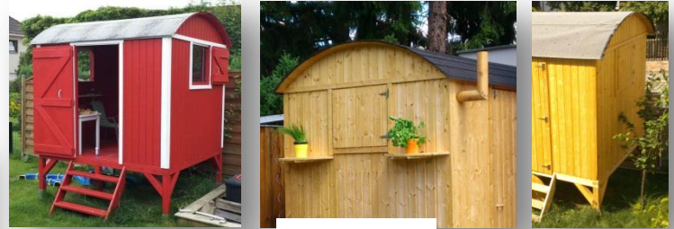
Kundenbilder sind freigegeben