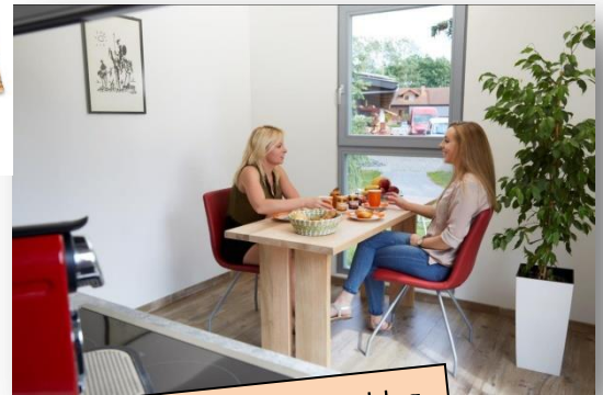
Musterbilder mit Einrichtungsvorschlag