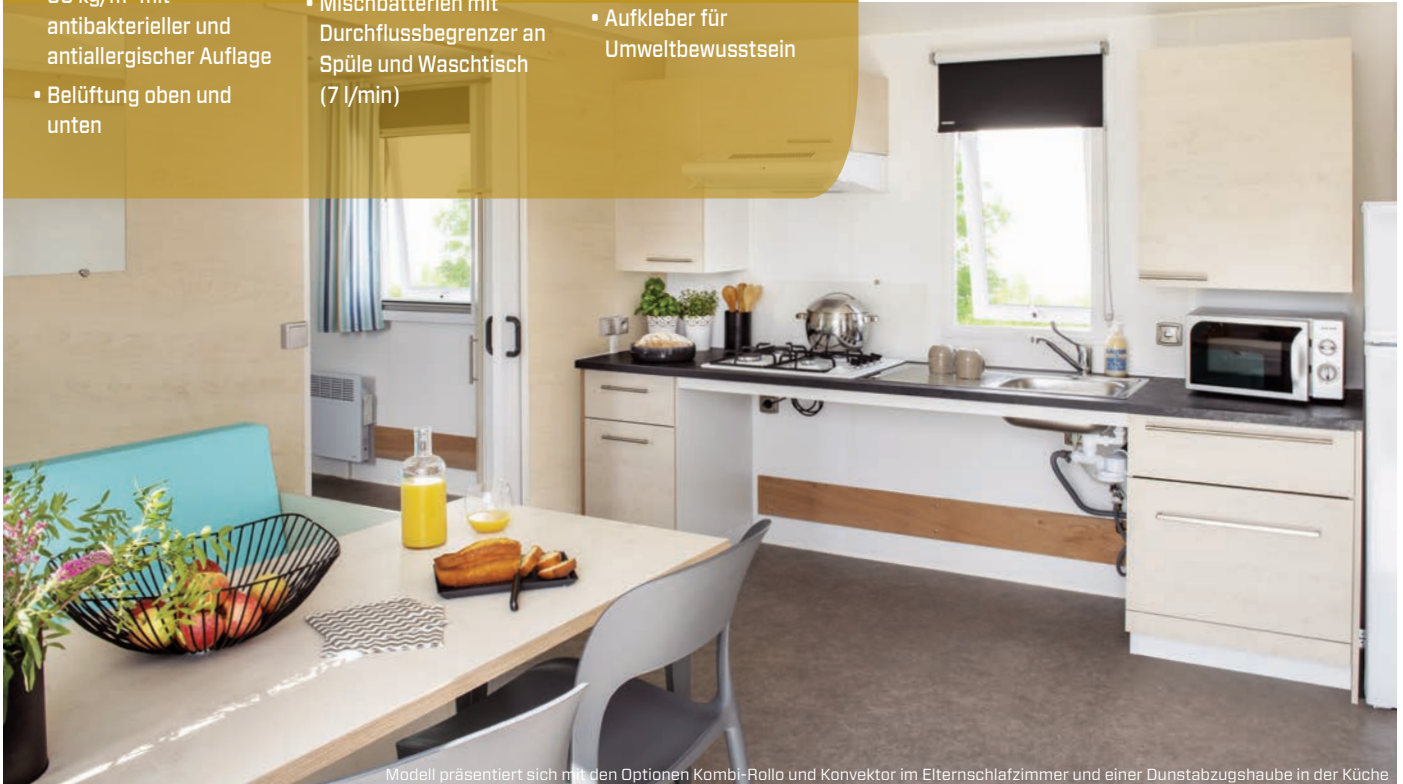
Modell präsentiert sich mit den Optionen Kombi-Rollo und Konvektor im Elternschlafzimmer und einer Dunstabzugshaube in der Küche