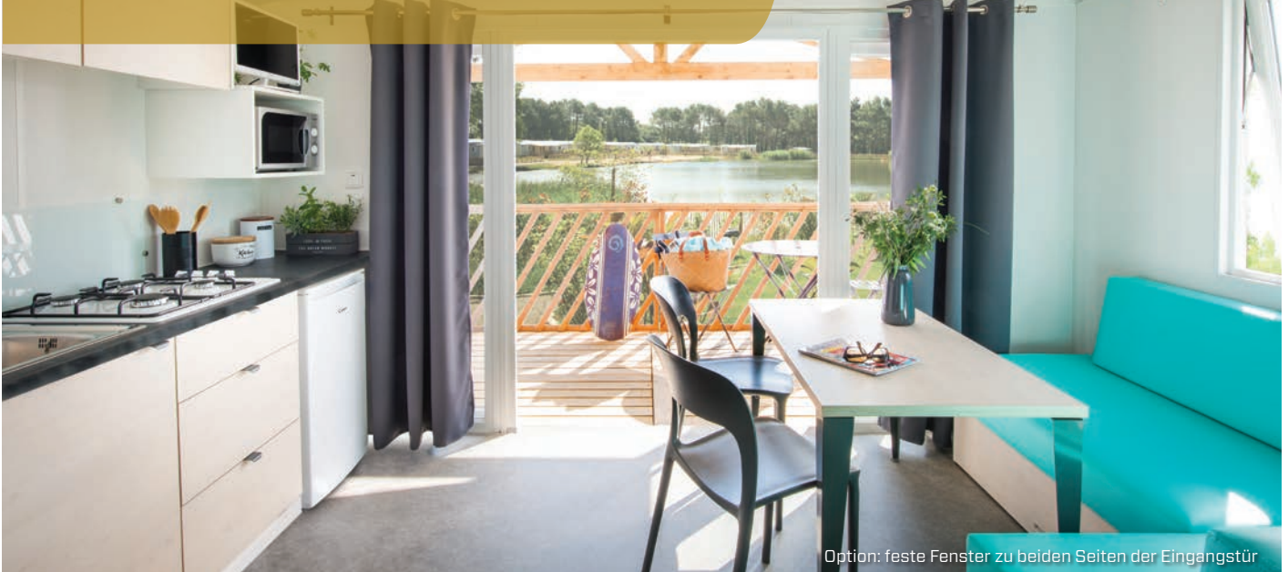
Option: feste Fenster zu beiden Seiten der Eingangstür