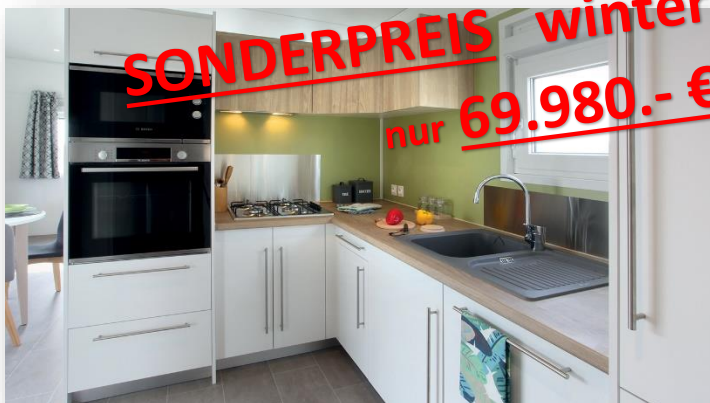
Küche: Designe 2022