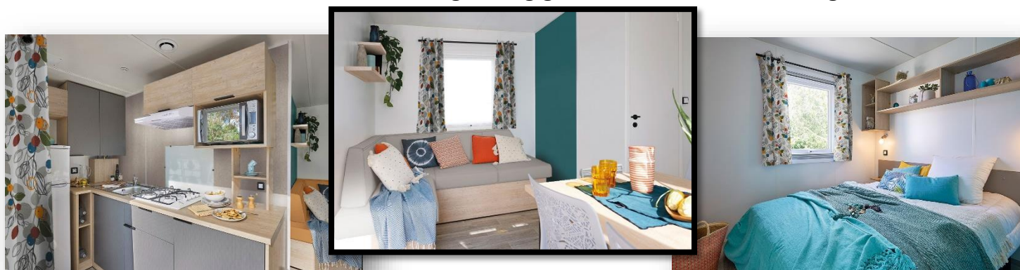
Musterbilder mit Optionen (Mehrpreis):

4 Schlafplätze (+2, Option Schlafsofa mit Mehrpreis), 2 Schlafzimmer, mit Wohn-Esszimmer, große L-Küche mit direktem Ausgang zur Terrasse, Bad mit Dusche (80 x 100 cm), sep. WC, viel Stauraum, komplett vermietetfertig möbliert inkl. Matratzen in den Schlafzimmern. Sehr gute Isolierung für kalte Tage geeignet, Platz für ein Babybett ist gegeben, 5 Polsterfarben und 3 Storefarben stehen zur Auswahl. 32 m 2 großzügige Wohnfläche. 8,70 m lang und 4,00 m breit.