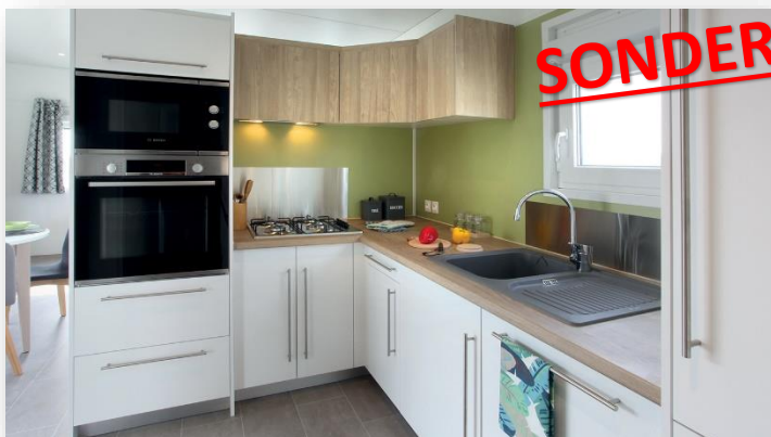
Küche: Designe 2020