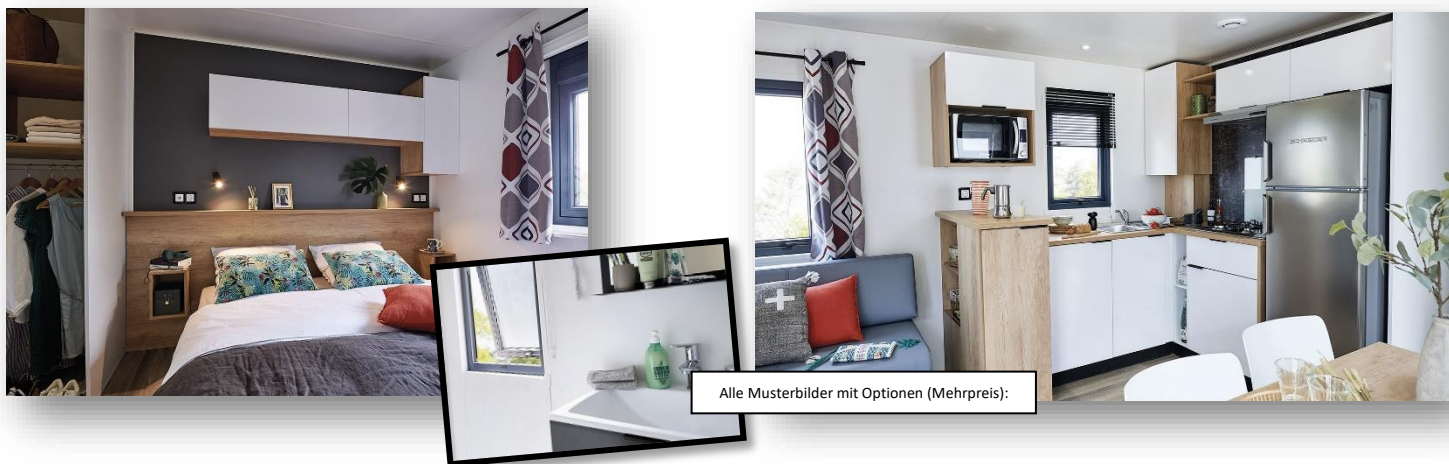
Alle Musterbilder mit Optionen (Mehrpreis):

4 Schlafplätze (+2, Option Schlafsofa mit Mehrpreis), 2 Schlafzimmer, üppiges Wohn-Esszimmer, große L-Küche, großer Ausgang zur Terrasse, Bad mit Dusche (80 x 100 cm), sep. WC, viel Stauraum, komplett wohnfertig möbliert inkl. Matratzen in den Schlafzimmern. Sehr gute Isolierung - für kühlere Tage geeignet, Platz für ein Babybett ist gegeben, 2 Storefarben stehen zur Auswahl. 32 m 2 großzügige Wohnfläche. 8,70 m lang und 4,00 m breit.