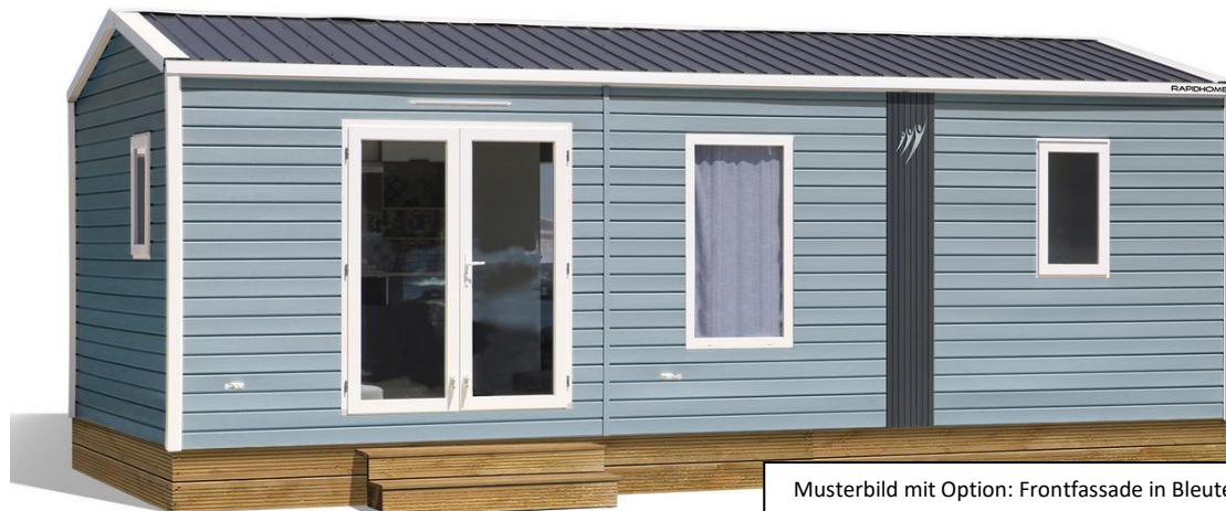
Musterbild mit Option: Frontfassade in Bleute, Mehrpreis

4 Schlafplätze*, 2 Schlafzimmer, mit Wohn-Esszimmer, große L-Küche mit direktem Ausgang zur Terrasse, Bad mit Dusche, sep. WC, viel Stauraum, komplett vermietetfertig möbliert inkl. Matratzen in den Schlafzimmern. Hochwertige Isolierung für kalte Tage geeignet, Platz für ein Babybett ist gegeben, 4 Polsterfarben und 3 Storefarben stehen zur Auswahl. Großzügige 29,5 m 2 Wohnfläche, 8,00 m lang und 4,00 m breit. Ein echtes Wohlfühlerlebnis für die ganze Familie.